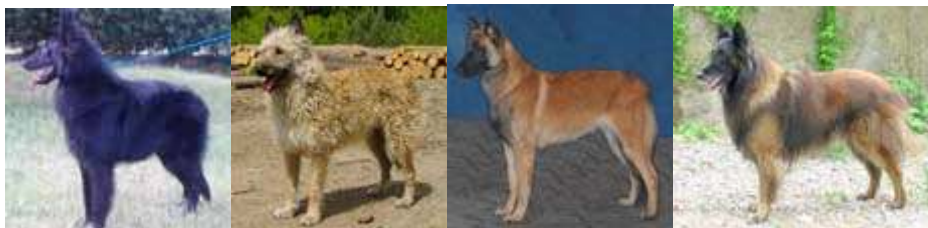
groenendael ,,,,,,,,,, laekenois ,,,,,,,,,, malinois ,,,,,,,,,, tervueren

le quattro varietà hanno caratteristiche comportamentali identiche. Cane molto dedito e affezionato alla famiglia e al proprio padrone, ha un'innata attitudine al ruolo di guardiano del gregge e della proprietà. È vigilante e attento; il suo sguardo vivo e interrogatore denota la sua intelligenza. All'occorrenza è, senza alcuna esitazione un'eccellente cane per la difesa personale, che riesce a far emergere il suo indomito coraggio e la sua straordinaria agilità. Compagno di giochi instancabile e affettuoso nei confronti dei bambini.